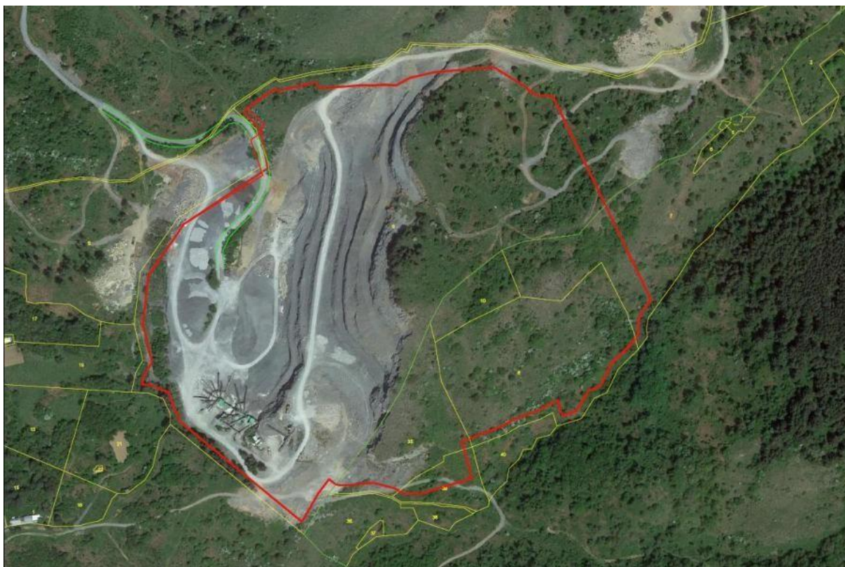
Fig.1: Area di cava (in rosso), suddivisione catastale (in giallo), limite comunale (in verde scuro) su base ortofoto (Fonte Google Earth).

Si riporta, nello specifico, la superficie di ogni particella interessata che sarà oggetto di attività estrattiva: